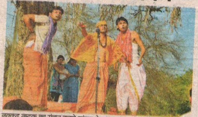
नुक्कड़ नाटक का मंचन करते खंडवा के कलाकार।

■ संस्था उदय ने अंचल में नुक्कड़ नाटक कर लोगों को बताए अधिकार